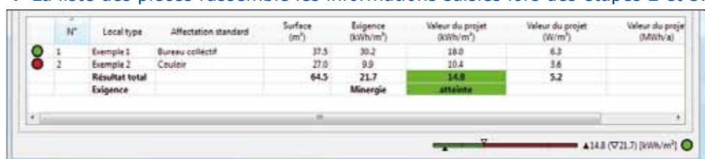
5 L'évaluation est établie automatiquement et est reconnu par Minergie.