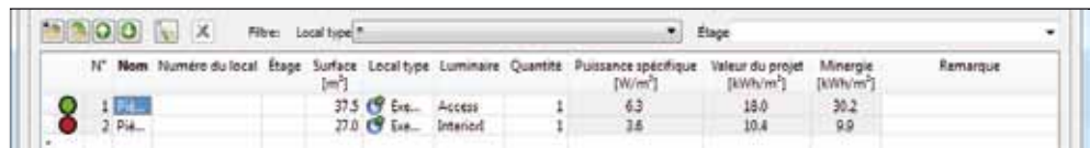
4 La liste des pièces rassemble les informations saisies lors des étapes 2 et 3.